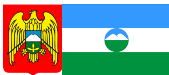
God?o i flaga Kabardo-Ba?karii